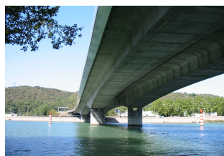
Les viaducs autoroutiers : nord et sud.

Dès 1876, on demande un 2 ème pont à Vienne ... 1932, son emplacement est fixé et sa longueur déterminée : 198,50 m. avec 3 ouvertures, dont une centrale de 108 m. largeur du tablier : 13 m. 1938 : première pierre. Fondation des piles de février 1939 à mai 1941, construction des arches de 1941 à 1943. 1944 : dynamitage. Il est reconstruit d'avril 1946 à mai 1949 et inauguré le 12 juin 1949 par V. Auriol.