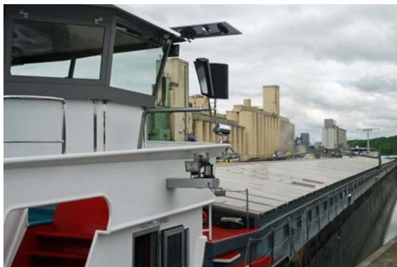
Automoteur (135 m, 3768 tonnes) chargeant du blé dans le Nouveau Port de Metz, premier port fluvial céréalier de France.

Que de contacts sympathiques et de matière à réflexion accumulés au cours de ces cinq journées passées entre Saône et Colbance! Tout ceci mérite assurément un compte rendu substantiel, actuellement en cours de préparation ; il sera présenté aux participants comme à l'ensemble des membres de Promofluvia et de l'Alliance des Rhodaniens le 6 février 2014 à 17 heures.