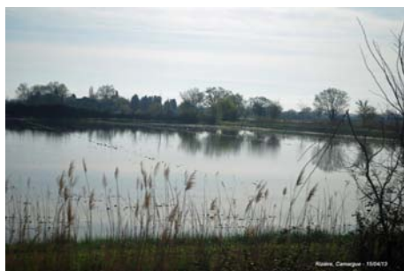
Rizière en Camargue