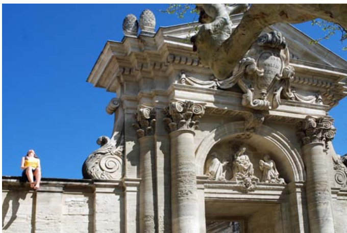
L'entrée de la chartreuse de Villeneuve-lès-Avignon

3. Des participations à de nombreuses réunions publiques : Pardon des Mariniers de LYON (humide !) le 2 juin 2012, Colloque IS Rivers le 26 juin, inauguration de la Maison Éclésiastique de PORT-BERNALIN le 15 septembre, inauguration de l'expo Idées - Barge le 3 décembre à GIVORS, Conférence Cinq à Sept sur Saône – Moselle, Saône - Rhin le 6 décembre, et sur le Schéma portuaire le 11 avril, Robins des Villes le 9 novembre à PIERRE-BENITE, les 30 ans de PROMOFLUVIA, les assemblées générales de l'Escolo de la Sedo le 15 décembre, de l'Office Interconsulaire des Transports du Sud-Est le 18 décembre, des Amis du Musée des Mariniers le 2 mars 2013, participations aux réunions de la Coordination des Voies d'Eau ou au Comité des Armements et des