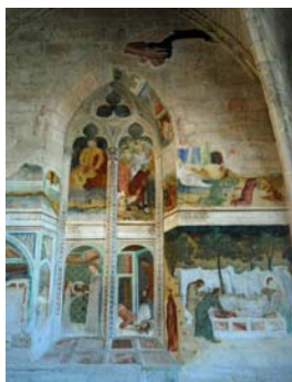
Fresque de Saint-Jean Baptiste - Chartreuse de Villeneuve