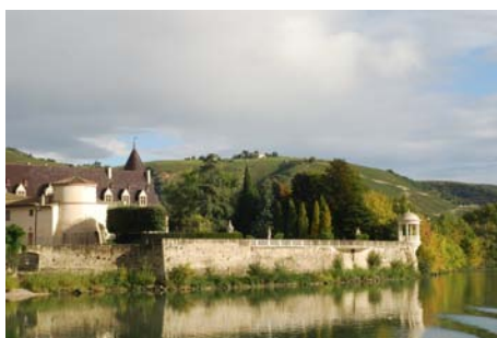
Château Guigal à Ampuis

Samedi 5 octobre 2013, avec l'Alliance des Rhodaniens et le Club des Plaisanciers du Lac du Bourget