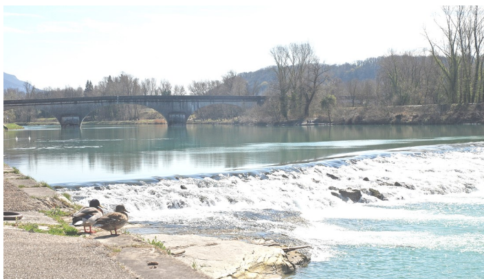
Pont et Grand Sault de Sault-Brenaz

Sous la conduite du conférencier et du maire, les participants se dirigent ensuite vers l'église bâtie en pierre locale.