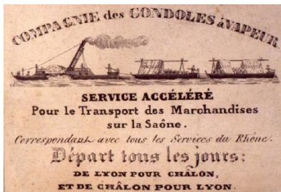
Une diligence d'eau